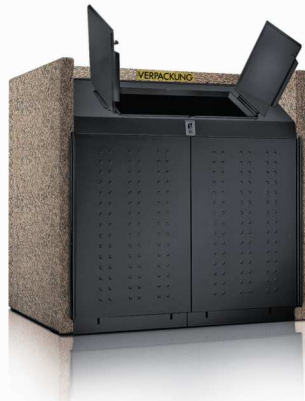
SILENT 1001 LVP