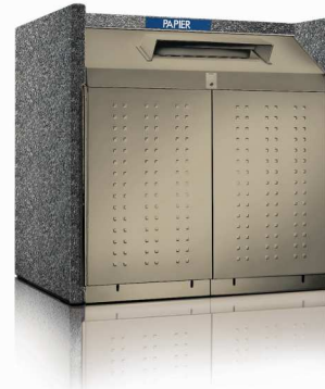
SILENT 1001 Paper