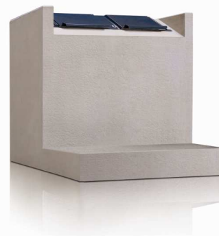
SILENT EH mit Trittstufe