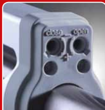
elektronische Endschalter mit Reed-Sensoren sorgen für präzise Endabschaltung

Stand: 02/2013. Druckfehler, Irrtümer und technische Änderungen vorbehalten.