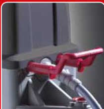
sicheres und komfortables Notentriegelungssystem; kein Werkzeug notwendig